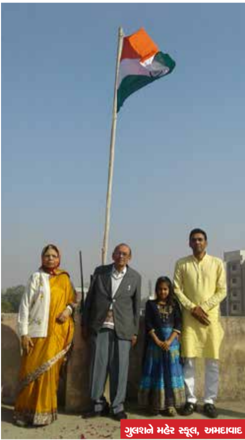
ગુલશને મહેર સ્કૂલ, અમદાવાદ

બોધ : આપણે કોઈનું અપમાન ન કરવું જોઈએ પછી આપણે જ પસ્તાઈએ છીએ. આપણે બહારથી નથી જોવાનું અંદરથી મનથી સમજવાનું હોય છે. અને આપણે કાગડાની જેમ મદદ કરવી જોઈએ.