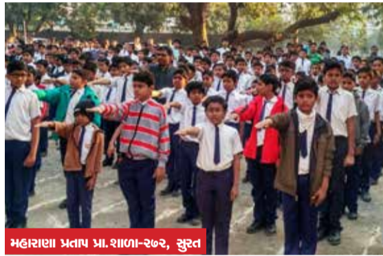
મહારાણા પ્રતાપ પ્રા. શાળા-૨૭૨, સુરત