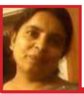
હર્ષા 6552 શિક્ષક, ભૂજ

તેઓ ઘણાં બધા વિવાદો સાથે જોડાયેલા રહ્યાં છે. પરંતુ પ્રથમ મહિલા રાષ્ટ્રપતિ રૂપે તેઓ સદાય યાદગાર રહ્યાં છે. અને સદાય યાદગાર રહેશે. બાળપણથી રાષ્ટ્રપતિ ભવન સુધીની પ્રતિભા પાટિલજીની યાત્રા એક પ્રેરક પ્રસંગ છે. અને મહિલા સશક્તિકરણની દિશામાં એક અનેરી આશાનું કિરણરૂપે રહ્યાં. ભારતીય ઈતિહાસનાં સોનેરી પાને આ ઐતિહાસિક ઘટના ખરેખર સ્મરણીય બની રહેશે.