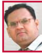
ટેજસ 6552 IT EXPERT www.tejashakkar.com

પેપર્સ અને કેટલીક વખત ભારે વસ્તુઓ પણ મુકતાં હોય છે, જે યોગ્ય નથી. આ કરવાથી લેપટોપની સ્કિનને નુકસાન થવાની શક્યતા છે. ■ લેપટોપને વારંવાર ફોર્મેટ ન કરો, આવું કરવાથી હાર્ડડિસ્ક ખરાબ થવાની શક્યતા રહે છે. ■ લેપટોપને બાળકોની પહોંચથી દૂર રાખો. ■ જો વીજળી અવારનવાર જતી હોય તો લેપટોપને અગાઉથી ચાર્જ કરી લેવું હિતાવહ છે, જેથી કરીને અગત્યનું કામ કરતી વખતે કોઈ પણ પ્રકારની સમસ્યા ન સર્જાય. ■ લેપટોપને સારી કવોલીટીની બેગમાં રાખવું જરૂરી છે. લેપટોપ બેગનો ઉપયોગ ફક્ત લેપટોપ રાખવા માટે થતો નથી, પરંતુ આકસ્મિક રીતે જો બેગ પડી જાય તો તેમાં રહેલાં લેપટોપને કોઈપણ પ્રકારનું નુકસાન ન થાય તે માટે પણ થાય છે. આજ પ્રકારની ટેકનોલોજીને લગતી બાબતો સાથે ટેકનોલોજીની દુનિયા હેઠળ The Open Page ના માધ્યમથી ફરી મળીશું. નવા વિચાર અને નવા ટેકનોલોજીને લગતાં મુદ્દા સાથે... અને હા.. આપના અમૂલ્ય સૂચનો The Open Page ના માધ્યમ થકી મોકલતાં રહેશો.